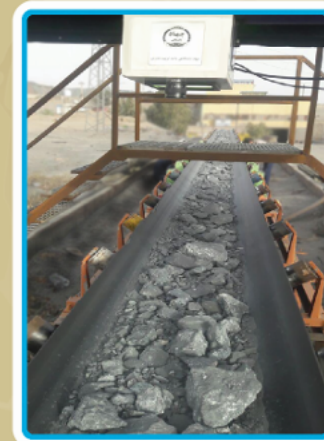
نصب دستگاه در مجموعه گل‌گهر