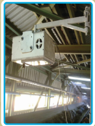
نصب دستگاه در مجموعه چغارت